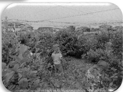
個々に持った入れ物を「いっぱいにする！」と張り切って摘んでいました。みんな色が濃くて大きいブルーベリーを選んでいましたよ。

今年はセミの声があまり聞こえない…なんて話もありますが絵本でセミを身近に感じてみてください。