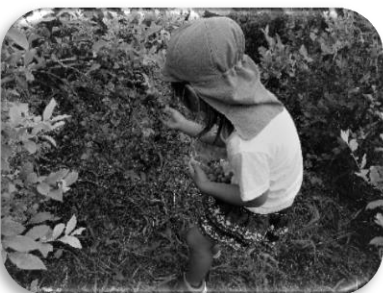
ブルーベリー摘み (5歳児) 7月19日(月) 今井地区にあるブルーベリー畑に行ってきました。

【個人面談について】 *6月・7月に幼児クラスの面談を行いました。たくさんのご参加ありがとうございました。動画を見ながらのお話しはいかがでしたでしょうか。今後も何かありましたら、お伝えください。 *9月・10月には0歳・1歳・2歳児クラスの面談を予定します。後日予定カレンダーを配布しますのでご確認ください。